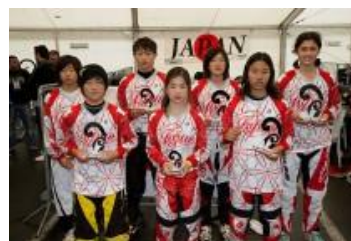
ガールズ14歳で日本勢がワンツーフィニッシュ